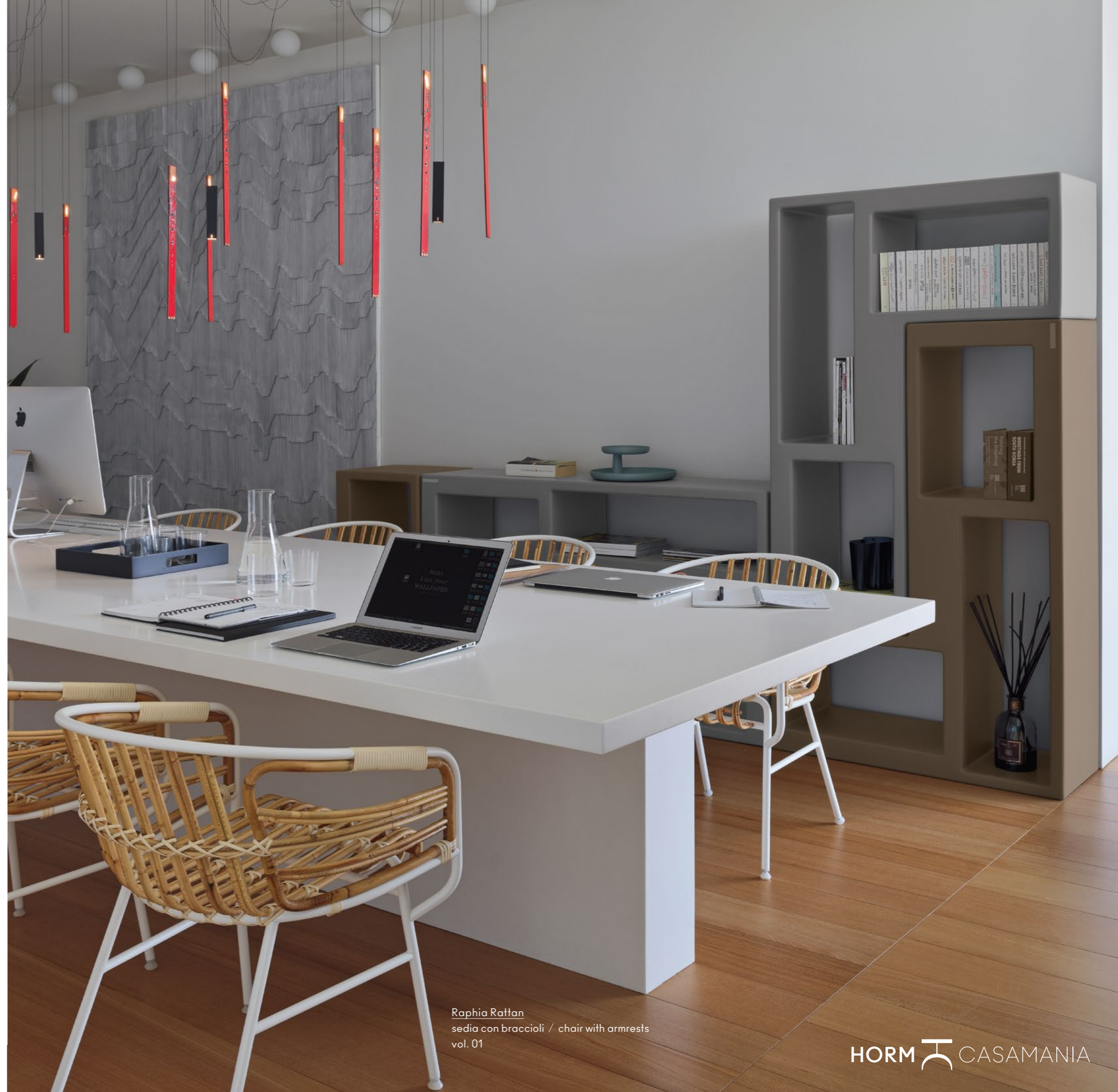
Raphia Rattan sedia con braccioli / chair with armrests vol. 01